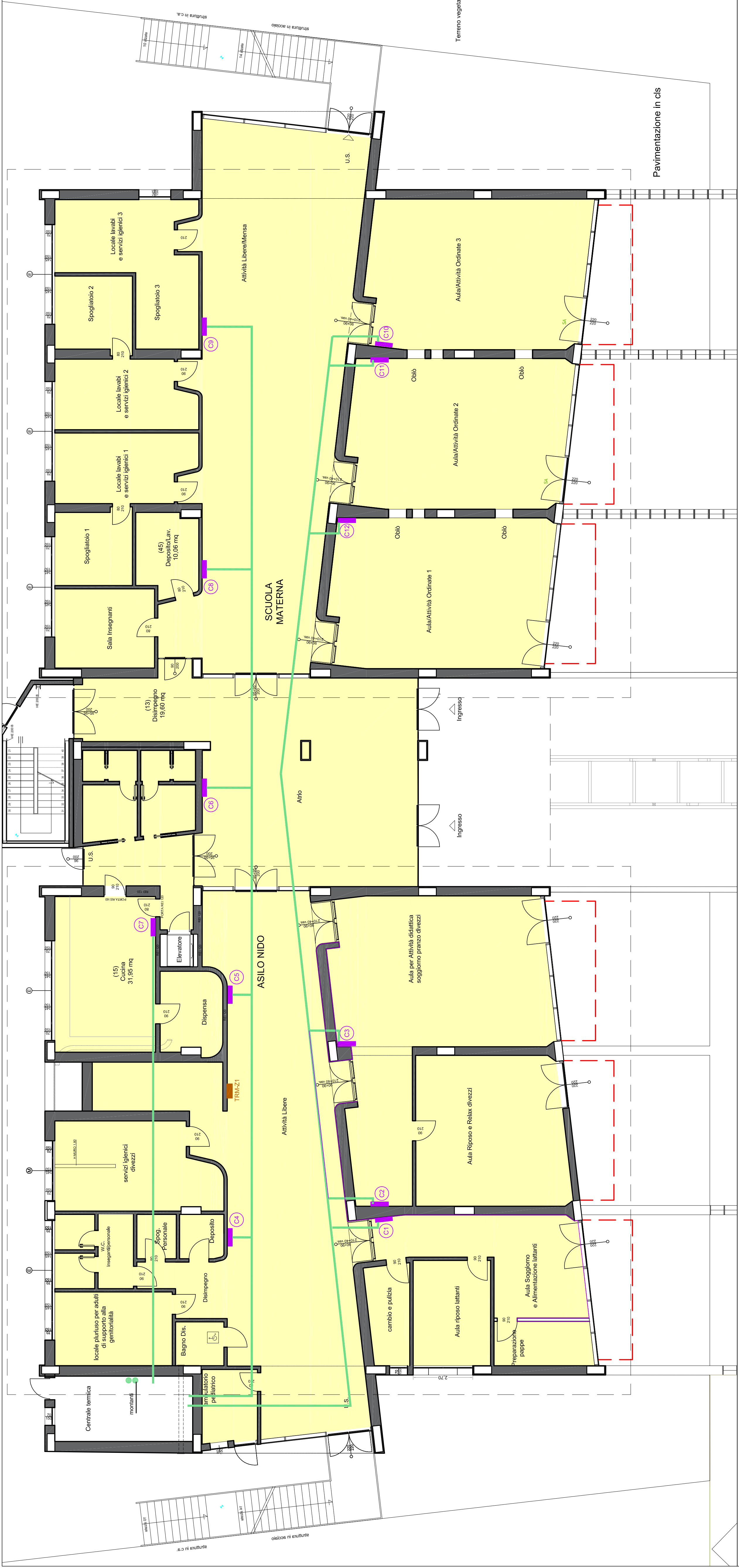
PIANTA PIANO TERZO scala 1/100