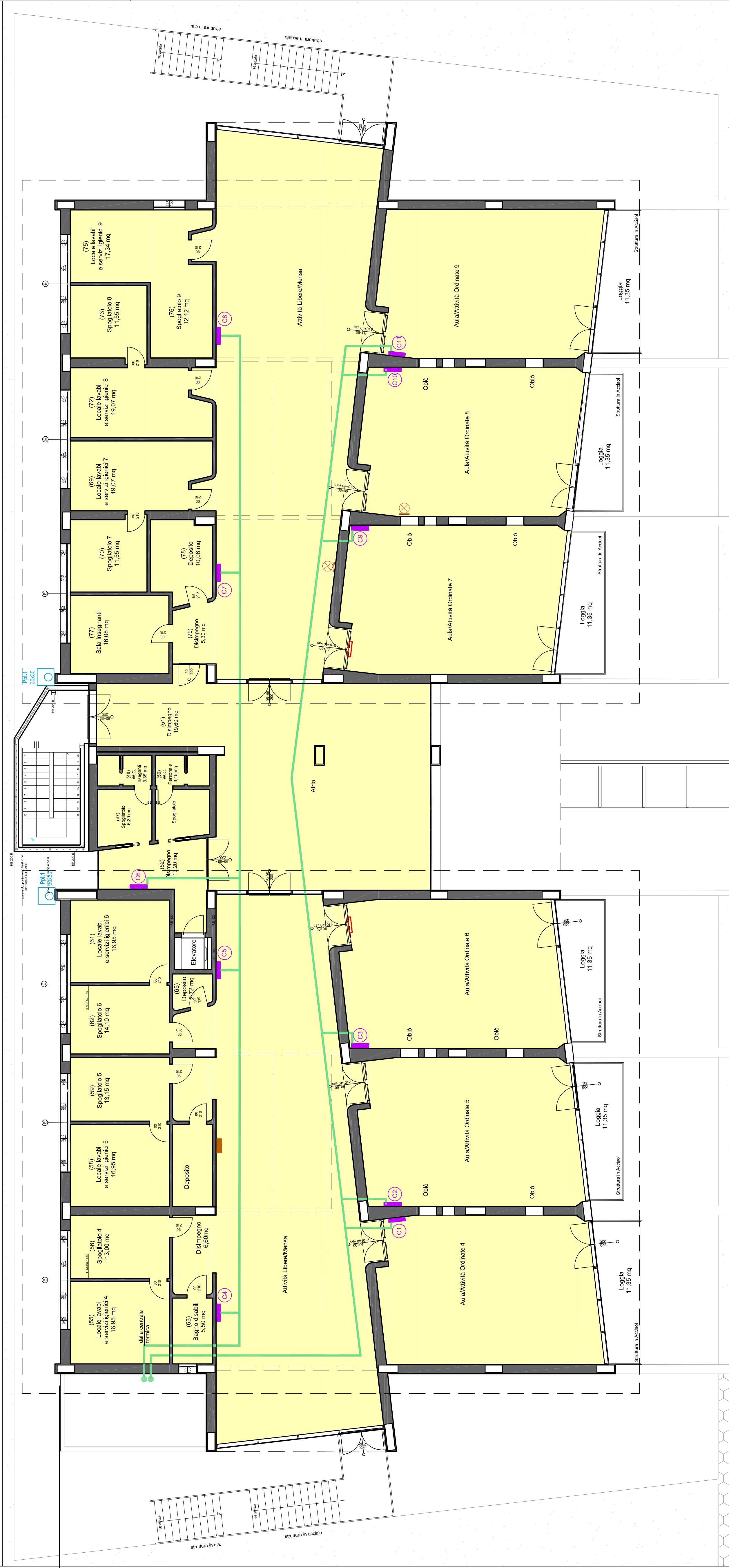
PIANTA PIANO SECONDO scala 1/100